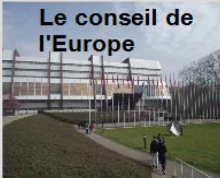
Le conseil de l'Europe