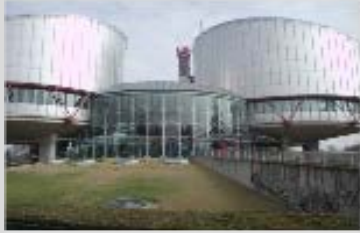
Parc du cinquantenaire