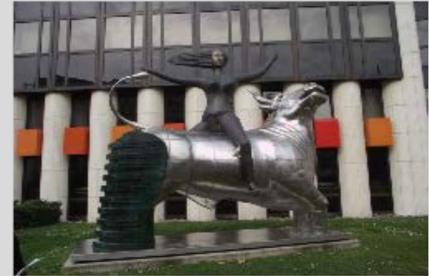
The Abduction of Europa