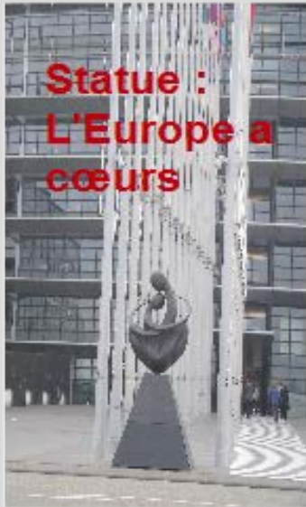
Statue : L'Europe à cœur